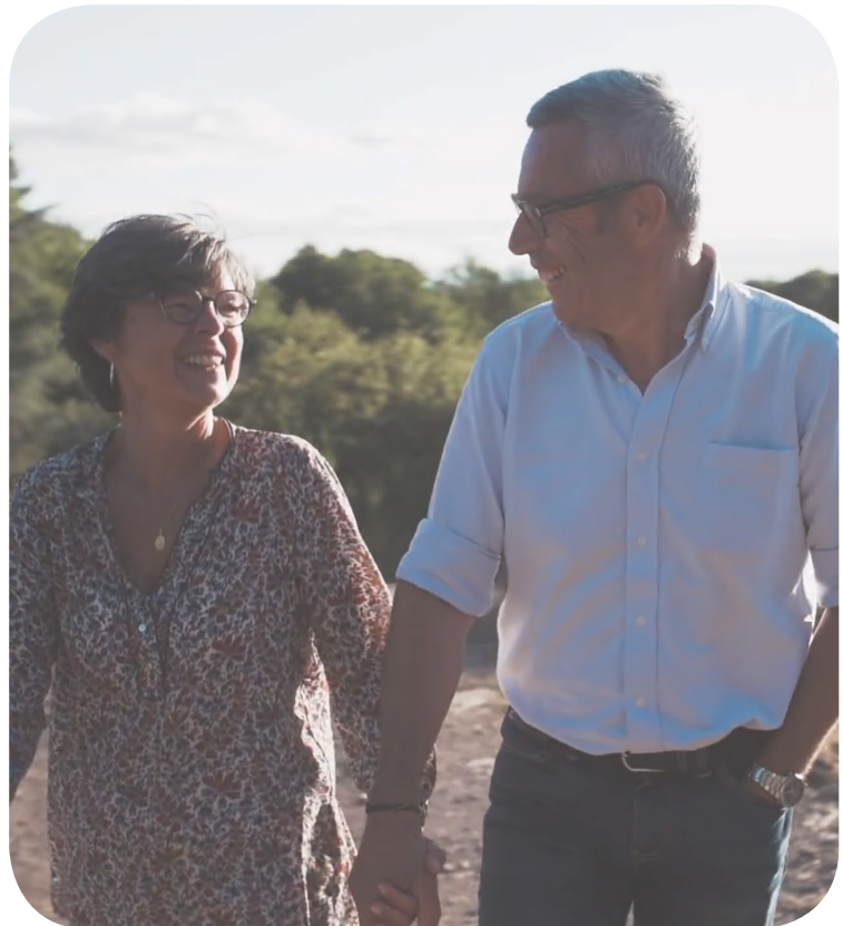
Illustration Extraits de la vidéo